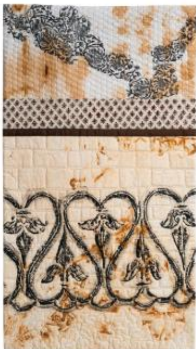
« Jali »