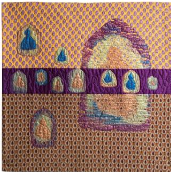
« Hope »